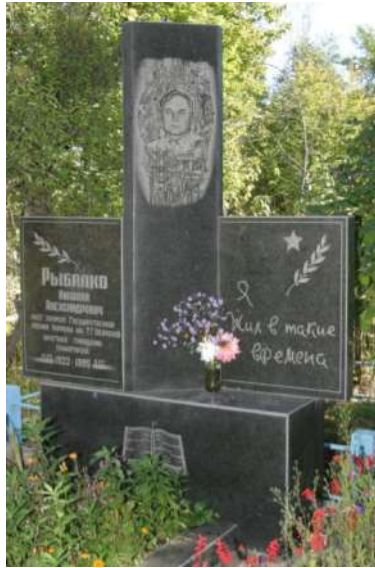
Пам'ятник на могилі поета Миколи Рибалка

Пам'ять про Миколу Олександровича Рибалка Краматорськ вшанував встановленням меморіальної дошки на будинку № 54 по вулиці Василя Стуса (колишня – Соціалістична), де останні роки жив поет. Крім того, ім'ям поета було названо одну з вулиць Краматорська та бібліотеку в мікрорайоні «Лазурний».