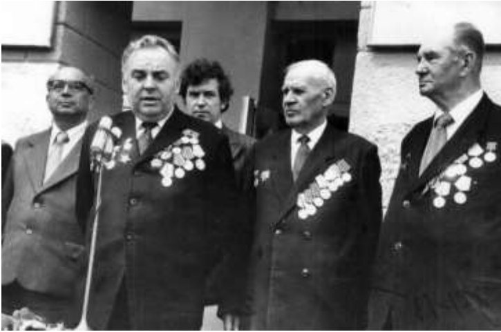
Виступ Миколи Рибалка в краматорській середній школі №1

У квітні 1972 року за заслуги в області літератури та у зв'язку з 50-тиріччям від дня народження Миколу Рибалка було нагороджено Почесною Грамотою Президії Верховної Ради УРСР.