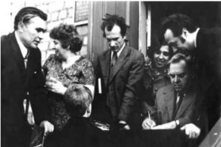
Микола Рибалко під час зустрічі з читачами

До бойових нагород додалися й такі відзнаки за літературну працю, як: ордени Жовтневої революції (1971), Дружби народів (1982), медалі. 1972 року поетові було присвоєно звання Почесного громадянина міста Краматорська.